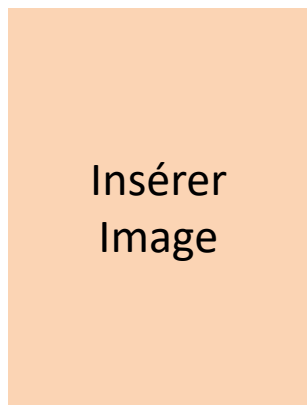
Titre de l'image